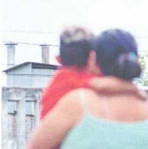
FÁBRICA Mar Reciclagem fica em Maracanaú