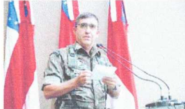
GENERAL Estavam Teophilo Gaspar de Oliveira