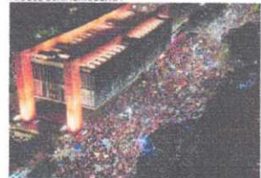
Festa da eleição de Lula lotou Avenida Paulista, mas não tem sido a tônica em manifestações da esquerda