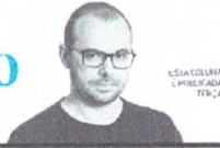
ESSA COLUNA É PUBLICADA TODA SEMANA