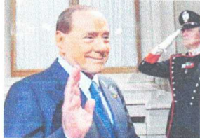
SILVIO Berlusconi morreu ontem, aos 86 anos