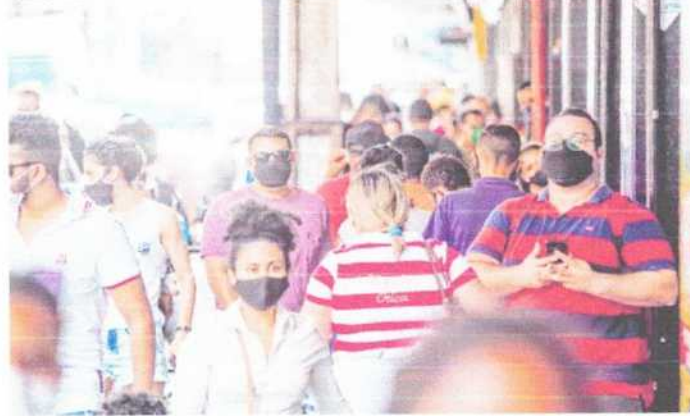
ESTADOS do Nordeste: pandemia cede nas capitais e se espalha por cidades do interior

ANA RUTE RAMIRES ruteramires@globo.com.br