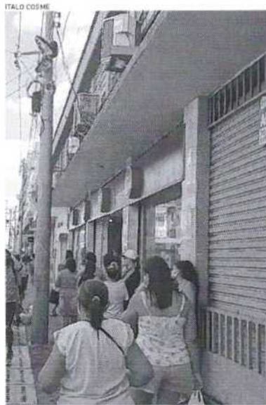
PANDEMIA impediu que 1,2 milhão de pessoas no Ceará procurassem emprego

Em relação ao sustento, a Pnad-Covid-19 apontou que em 60,2% dos domicílios cearenses alguém recebeu algum tipo de recurso financeiro, como auxílio emergencial ou seguro-desemprego.