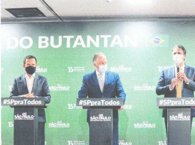
GOVERNADOR de São Paulo, João Dória; do Espírito Santo, Renato Casagrande, e do Ceará, Camilo Santana; na solenidade em São Paulo