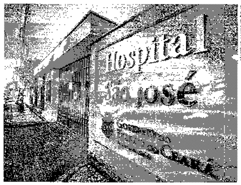
HOSPITAL São José está com a UTI lotada

"Foi um aumento muito específico, que nos deixa muito preocupados", relata o gestor em vídeo publicado no canal